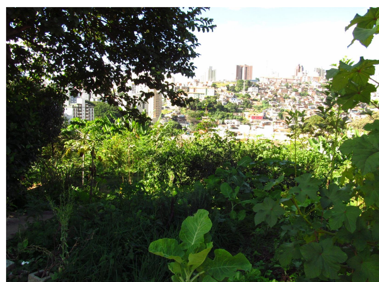
Centre de Perception Agroécologique (CEVAE), à Belo Horizonte.